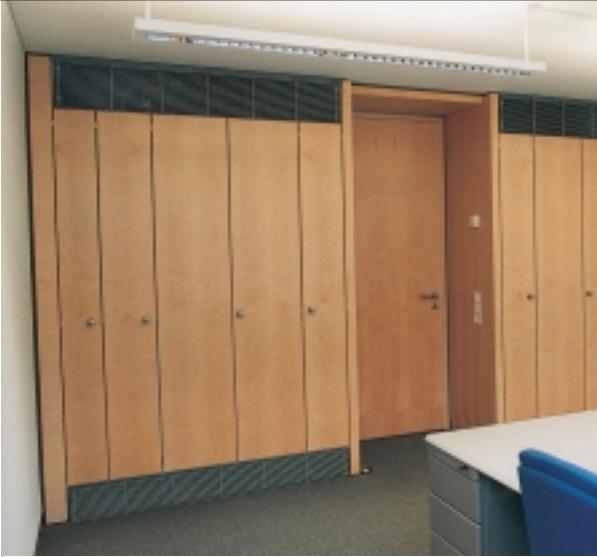
Schranksystem mit ADO gTHERM in der Praxis